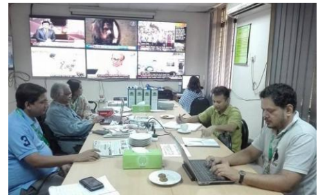
আজ নিয়ন্ত্রণ কক্ষে কর্মব্যস্ততা

গত কয়েকদিন ধরে সাগরে নিম্নচাপের প্রভাবে দেশব্যাপী বৃষ্টি হচ্ছে। বৃষ্টির পানি জমে থাকতে পারে এমন সব স্থান থেকে পানি ফেলে দেয়ার ব্যবস্থা নিতে হবে। কারো মালিকানা নেই এমন সব পরিত্যক্ত দালান-কোঠা, নষ্ট যানবাহন, নষ্ট যন্ত্রপাতি পানিশূন্য করার জন্য নাগরিকদের নিজেরা উদ্যোগ নিতে পারেন, বা সিটি কর্পোরেশন/ পৌর সভা কর্তৃপক্ষকে জানাতে পারেন। পুলিশ কর্তৃপক্ষ দ্বারা আটক করা যে সব যানবাহন ও অন্যান্য সামগ্রী খোলা জায়গাতে রাখা হয়েছে, সেখানে বৃষ্টির পানি জমা হতে পারে। বিমান বন্দর, নৌবন্দর, স্থল বন্দরেও একই ভাবে খোলা জায়গায় পড়ে থাকা যানবাহন, কন্টেইনার ও অন্যান্য যন্ত্রপাতিতে বৃষ্টির পানি জমতে পারে। সরকারী-বেসরকারী ভবনের ছাদে, কার্নিশে বৃষ্টির পানি জমতে পারে। গাছের কোটরে, গাছের বড় পাতার ভাঁজে পানি জমতে পারে। ব্যক্তিগত বাগানে-খামারে, পার্কে, রাস্তার পাশে ঝোপ-ঝাড় গাছ-পালায় এটা হতে পারে। এ ধরনের জায়গা ও আধারে জমে থাকা পানি এডিস মশা জন্মাবার অনুকূল পরিবেশ। এসব স্থানে জমে থাকা পানি পরিষ্কার করার জন্য কর্তৃপক্ষ যেমন সক্রিয় থাকবেন, তেমনি সক্রিয় নাগরিক উদ্যোগও প্রয়োজন।