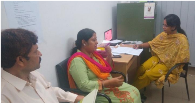
আজ চিকুনগুনিয়া নমুনা সংগ্রহ কক্ষে চিকিৎসক পরামর্শ দিচ্ছেন

** এদের ঢাকা মহানগরে ভ্রমণের ইতিহাস আছে ও এরা অধিকাংশ পোস্টচিকুনগুনিয়া আর্থাইটিস এ আক্রান্ত।